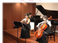
お菓子をご用意しております。 お気軽にお越しくださいませ。